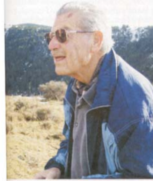
JOSEP L. GÀZQUEZ/J.R. SEGURA Centre Excursionista de Lleida

Havent dinat l'ajuntament d'Isona ens ofereix la possibilitat de visitar l'interior de l'església de Covet, joia romànica de segle XII.